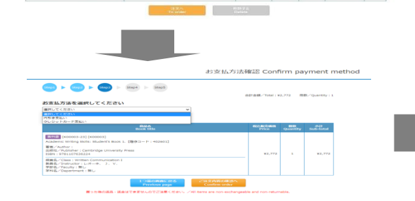
※注文が確定すると「注文承りメール」が送信されます。